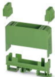
Elektronik-Gehäuse-Set, bestehend aus Elektronik-Gehäuse und Print-Klemmenblöcken, Raster 5

Bitte beachten Sie, dass die hier angegebenen Daten dem Online-Katalog entnommen sind. Die vollständigen Informationen und Daten entnehmen Sie bitte der Anwenderdokumentation. Es gelten die Allgemeinen Nutzungsbedingungen für Internet-Downloads. ( http://download.phoenixcontact.de )