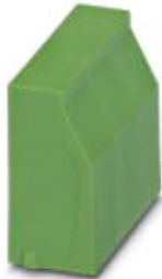
Blindstopfen, für unbestückte Klemmstellen

Bitte beachten Sie, dass die hier angegebenen Daten dem Online-Katalog entnommen sind. Die vollständigen Informationen und Daten entnehmen Sie bitte der Anwenderdokumentation. Es gelten die Allgemeinen Nutzungsbedingungen für Internet-Downloads. ( http://download.phoenixcontact.de )