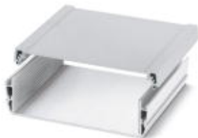
Aufbaugehäuse, Unterteil, Farbe: aluminium, Breite: 150 mm

Bitte beachten Sie, dass die hier angegebenen Daten dem Online-Katalog entnommen sind. Die vollständigen Informationen und Daten entnehmen Sie bitte der Anwenderdokumentation. Es gelten die Allgemeinen Nutzungsbedingungen für Internet-Downloads. ( http://download.phoenixcontact.de )