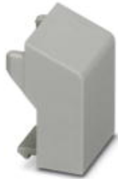
Blindstopfen, für unbestückte Klemmstellen

Bitte beachten Sie, dass die hier angegebenen Daten dem Online-Katalog entnommen sind. Die vollständigen Informationen und Daten entnehmen Sie bitte der Anwenderdokumentation. Es gelten die Allgemeinen Nutzungsbedingungen für Internet-Downloads. ( http://download.phoenixcontact.de )