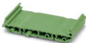
Elektronik-Aufbaugeschütz, Steckmodul-Basiselement, Verpackungsmenge: 500

Bitte beachten Sie, dass die hier angegebenen Daten dem Online-Katalog entnommen sind. Die vollständigen Informationen und Daten entnehmen Sie bitte der Anwenderdokumentation. Es gelten die Allgemeinen Nutzungsbedingungen für Internet-Downloads. ( http://download.phoenixcontact.de )