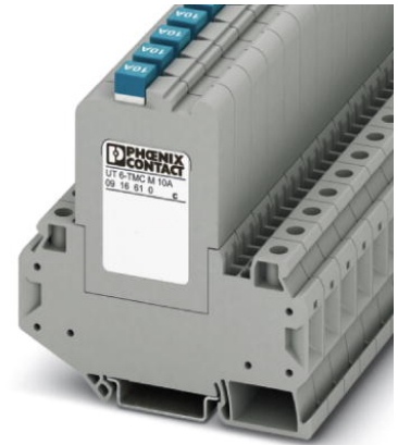
Bild zeigt die 10 Ampère-Variante

http://eshop.phoenixcontact.de/phoenix/treeViewClick.do?UID=0916609