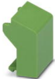
Blindstopfen, für unbestückte Klemmstellen

Bitte beachten Sie, dass die hier angegebenen Daten dem Online-Katalog entnommen sind. Die vollständigen Informationen und Daten entnehmen Sie bitte der Anwenderdokumentation. Es gelten die Allgemeinen Nutzungsbedingungen für Internet-Downloads. ( http://download.phoenixcontact.de )