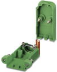
Kabelgehäuse, Rastermaß: 0 mm, Polzahl: 5, Maß a: 39,9 mm, Farbe: grün

Bitte beachten Sie, dass die hier angegebenen Daten dem Online-Katalog entnommen sind. Die vollständigen Informationen und Daten entnehmen Sie bitte der Anwenderdokumentation. Es gelten die Allgemeinen Nutzungsbedingungen für Internet-Downloads. ( http://download.phoenixcontact.de )