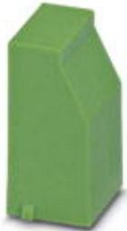
Blindstopfen, für unbestückte Klemmstellen

Bitte beachten Sie, dass die hier angegebenen Daten dem Online-Katalog entnommen sind. Die vollständigen Informationen und Daten entnehmen Sie bitte der Anwenderdokumentation. Es gelten die Allgemeinen Nutzungsbedingungen für Internet-Downloads. ( http://download.phoenixcontact.de )