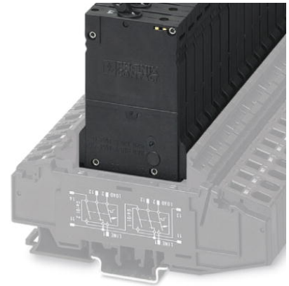
Abbildung zeigt die Variante TMCP 1 F1 300 2,0A

http://eshop.phoenixcontact.de/phoenix/treeViewClick.do?UID=0915823