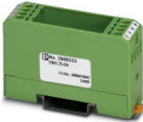
Bestückungs-Modul, bestehend aus Gehäuse, Anschlussklemmen MKDS 3 und Leiterplatte

Bitte beachten Sie, dass die hier angegebenen Daten dem Online-Katalog entnommen sind. Die vollständigen Informationen und Daten entnehmen Sie bitte der Anwenderdokumentation. Es gelten die Allgemeinen Nutzungsbedingungen für Internet-Downloads. ( http://download.phoenixcontact.de )