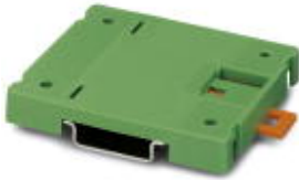
Montageplatte, zum Aufschrauben von Schaltgeräten der Größe 0

Bitte beachten Sie, dass die hier angegebenen Daten dem Online-Katalog entnommen sind. Die vollständigen Informationen und Daten entnehmen Sie bitte der Anwenderdokumentation. Es gelten die Allgemeinen Nutzungsbedingungen für Internet-Downloads. ( http://download.phoenixcontact.de )