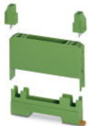
Elektronik-Gehäuse-Set, bestehend aus Elektronik-Gehäuse und Print-Klemmenblöcken, Raster 5

Bitte beachten Sie, dass die hier angegebenen Daten dem Online-Katalog entnommen sind. Die vollständigen Informationen und Daten entnehmen Sie bitte der Anwenderdokumentation. Es gelten die Allgemeinen Nutzungsbedingungen für Internet-Downloads. ( http://download.phoenixcontact.de )