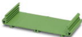
Strangprofil-Aufbaugehäuse, mit einer Baubreite von 108 mm und einer Festlänge von 200 cm

Bitte beachten Sie, dass die hier angegebenen Daten dem Online-Katalog entnommen sind. Die vollständigen Informationen und Daten entnehmen Sie bitte der Anwenderdokumentation. Es gelten die Allgemeinen Nutzungsbedingungen für Internet-Downloads. ( http://download.phoenixcontact.de )