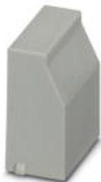
Blindstopfen, für unbestückte Klemmstellen

Bitte beachten Sie, dass die hier angegebenen Daten dem Online-Katalog entnommen sind. Die vollständigen Informationen und Daten entnehmen Sie bitte der Anwenderdokumentation. Es gelten die Allgemeinen Nutzungsbedingungen für Internet-Downloads. ( http://download.phoenixcontact.de )