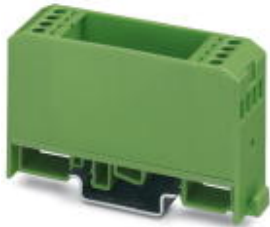
Elektronik-Gehäuse, mit Universalfuß, zum Einsetzen einer Leiterplatte, ohne Schraubanschlussklemmen und Haube

Bitte beachten Sie, dass die hier angegebenen Daten dem Online-Katalog entnommen sind. Die vollständigen Informationen und Daten entnehmen Sie bitte der Anwenderdokumentation. Es gelten die Allgemeinen Nutzungsbedingungen für Internet-Downloads. ( http://download.phoenixcontact.de )