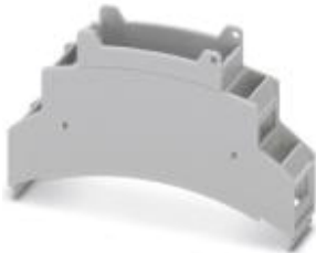
Oberteil für Installationsgehäuse BC, vorbereitet für den Einsatz von MKDSO-Anschluss-technik, Breite: 17,8 mm

Bitte beachten Sie, dass die hier angegebenen Daten dem Online-Katalog entnommen sind. Die vollständigen Informationen und Daten entnehmen Sie bitte der Anwenderdokumentation. Es gelten die Allgemeinen Nutzungsbedingungen für Internet-Downloads. ( http://download.phoenixcontact.de )