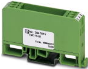
Bestückungs-Modul, bestehend aus Gehäuse, Anschlussklemmen MKDS 3 und Leiterplatte

Bitte beachten Sie, dass die hier angegebenen Daten dem Online-Katalog entnommen sind. Die vollständigen Informationen und Daten entnehmen Sie bitte der Anwenderdokumentation. Es gelten die Allgemeinen Nutzungsbedingungen für Internet-Downloads. ( http://download.phoenixcontact.de )