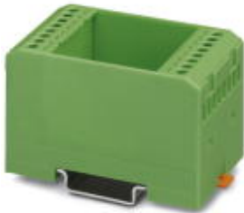
Elektronik-Gehäuse, zum Einsetzen einer Leiterplatte, ohne Schraubanschlussklemmen und Haube

Bitte beachten Sie, dass die hier angegebenen Daten dem Online-Katalog entnommen sind. Die vollständigen Informationen und Daten entnehmen Sie bitte der Anwenderdokumentation. Es gelten die Allgemeinen Nutzungsbedingungen für Internet-Downloads. ( http://download.phoenixcontact.de )