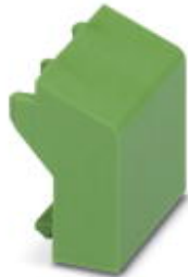
Blindstopfen, für unbestückte Klemmstellen

Bitte beachten Sie, dass die hier angegebenen Daten dem Online-Katalog entnommen sind. Die vollständigen Informationen und Daten entnehmen Sie bitte der Anwenderdokumentation. Es gelten die Allgemeinen Nutzungsbedingungen für Internet-Downloads. ( http://download.phoenixcontact.de )