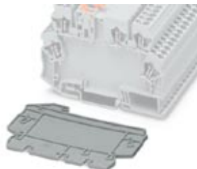
Seitendeckel, zum Verschließen des Gehäuses für Schutzart IP20

Bitte beachten Sie, dass die hier angegebenen Daten dem Online-Katalog entnommen sind. Die vollständigen Informationen und Daten entnehmen Sie bitte der Anwenderdokumentation. Es gelten die Allgemeinen Nutzungsbedingungen für Internet-Downloads. ( http://download.phoenixcontact.de )