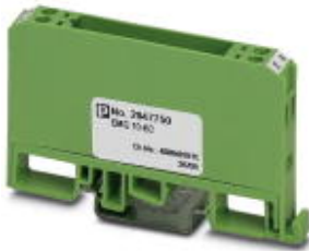
Bestückungs-Modul, bestehend aus Gehäuse, Anschlussklemmen MKDS 3 und Leiterplatte

Bitte beachten Sie, dass die hier angegebenen Daten dem Online-Katalog entnommen sind. Die vollständigen Informationen und Daten entnehmen Sie bitte der Anwenderdokumentation. Es gelten die Allgemeinen Nutzungsbedingungen für Internet-Downloads. ( http://download.phoenixcontact.de )