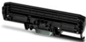
Seitenelement (links) mit Montagefuß für die Tragschiene für UM-PRO-Profile der Breite 122 mm

Bitte beachten Sie, dass die hier angegebenen Daten dem Online-Katalog entnommen sind. Die vollständigen Informationen und Daten entnehmen Sie bitte der Anwenderdokumentation. Es gelten die Allgemeinen Nutzungsbedingungen für Internet-Downloads. ( http://download.phoenixcontact.de )