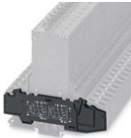
Abschlussdeckel, Länge: 115 mm, Breite: 6 mm, Farbe: schwarz

Bitte beachten Sie, dass die hier angegebenen Daten dem Online-Katalog entnommen sind. Die vollständigen Informationen und Daten entnehmen Sie bitte der Anwenderdokumentation. Es gelten die Allgemeinen Nutzungsbedingungen für Internet-Downloads. ( http://download.phoenixcontact.de )