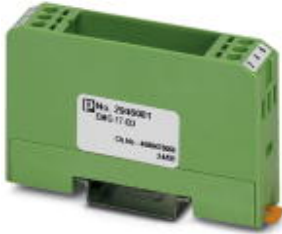
Bestückungs-Modul, bestehend aus Gehäuse, Anschlussklemmen MKDS 3 und Leiterplatte

Bitte beachten Sie, dass die hier angegebenen Daten dem Online-Katalog entnommen sind. Die vollständigen Informationen und Daten entnehmen Sie bitte der Anwenderdokumentation. Es gelten die Allgemeinen Nutzungsbedingungen für Internet-Downloads. ( http://download.phoenixcontact.de )