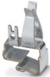
Funktionserdkontakt für Zwischenelemente.

Bitte beachten Sie, dass die hier angegebenen Daten dem Online-Katalog entnommen sind. Die vollständigen Informationen und Daten entnehmen Sie bitte der Anwenderdokumentation. Es gelten die Allgemeinen Nutzungsbedingungen für Internet-Downloads. ( http://download.phoenixcontact.de )