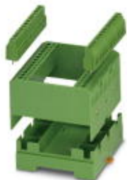
Elektronik-Gehäuse-Set, bestehend aus Elektronikmodul und Print-Klemmenblöcken, Raster 5

Bitte beachten Sie, dass die hier angegebenen Daten dem Online-Katalog entnommen sind. Die vollständigen Informationen und Daten entnehmen Sie bitte der Anwenderdokumentation. Es gelten die Allgemeinen Nutzungsbedingungen für Internet-Downloads. ( http://download.phoenixcontact.de )