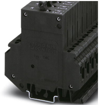
Abbildung zeigt die Variante TMC 1 F1 100 1A

http://eshop.phoenixcontact.de/phoenix/treeViewClick.do?UID=0914840