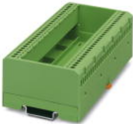
Elektronik-Gehäuse, zum Einsetzen einer Leiterplatte, ohne Schraubanschlussklemmen und Haube

Bitte beachten Sie, dass die hier angegebenen Daten dem Online-Katalog entnommen sind. Die vollständigen Informationen und Daten entnehmen Sie bitte der Anwenderdokumentation. Es gelten die Allgemeinen Nutzungsbedingungen für Internet-Downloads. ( http://download.phoenixcontact.de )