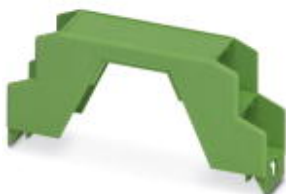
Gehäuse-Oberteil, für COMBICON-Anschluss, 2-stöckig

Bitte beachten Sie, dass die hier angegebenen Daten dem Online-Katalog entnommen sind. Die vollständigen Informationen und Daten entnehmen Sie bitte der Anwenderdokumentation. Es gelten die Allgemeinen Nutzungsbedingungen für Internet-Downloads. ( http://download.phoenixcontact.de )