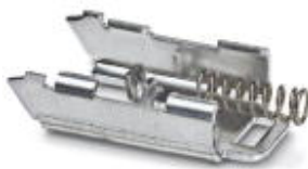
Metallfußriegel, für Zwischenelemente.

Bitte beachten Sie, dass die hier angegebenen Daten dem Online-Katalog entnommen sind. Die vollständigen Informationen und Daten entnehmen Sie bitte der Anwenderdokumentation. Es gelten die Allgemeinen Nutzungsbedingungen für Internet-Downloads. ( http://download.phoenixcontact.de )