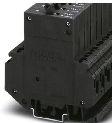
Abbildung zeigt die Variante TMC 1 F1 100 1A

http://eshop.phoenixcontact.de/phoenix/treeViewClick.do?UID=0914976