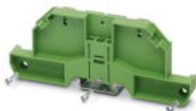
Seitenelement, für Profilabdeckung UM 122 auf Tragschiene NS 35/7,5, mit Schraubenbefestigung M3-Schraube, Anzugsmoment 0,5 Nm ... 0,6 Nm

Bitte beachten Sie, dass die hier angegebenen Daten dem Online-Katalog entnommen sind. Die vollständigen Informationen und Daten entnehmen Sie bitte der Anwenderdokumentation. Es gelten die Allgemeinen Nutzungsbedingungen für Internet-Downloads. ( http://download.phoenixcontact.de )