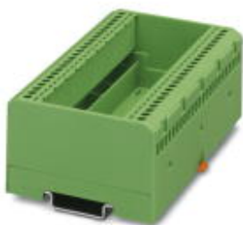
Elektronik-Gehäuse, zum Einsetzen einer Leiterplatte, ohne Schraubanschlussklemmen und Haube

Bitte beachten Sie, dass die hier angegebenen Daten dem Online-Katalog entnommen sind. Die vollständigen Informationen und Daten entnehmen Sie bitte der Anwenderdokumentation. Es gelten die Allgemeinen Nutzungsbedingungen für Internet-Downloads. ( http://download.phoenixcontact.de )