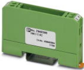
Bestückungs-Modul, bestehend aus Gehäuse, Anschlussklemmen MKDS 3 und Leiterplatte

Bitte beachten Sie, dass die hier angegebenen Daten dem Online-Katalog entnommen sind. Die vollständigen Informationen und Daten entnehmen Sie bitte der Anwenderdokumentation. Es gelten die Allgemeinen Nutzungsbedingungen für Internet-Downloads. ( http://download.phoenixcontact.de )