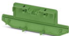
Seitenelement, niedrige Ausführung, für 73 mm breite U-Profil-Abdeckung

Bitte beachten Sie, dass die hier angegebenen Daten dem Online-Katalog entnommen sind. Die vollständigen Informationen und Daten entnehmen Sie bitte der Anwenderdokumentation. Es gelten die Allgemeinen Nutzungsbedingungen für Internet-Downloads. ( http://download.phoenixcontact.de )