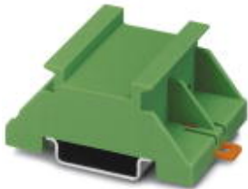
Montageplatte zum Aufschrauben von Schaltgeräten, niedrige Ausführung

Bitte beachten Sie, dass die hier angegebenen Daten dem Online-Katalog entnommen sind. Die vollständigen Informationen und Daten entnehmen Sie bitte der Anwenderdokumentation. Es gelten die Allgemeinen Nutzungsbedingungen für Internet-Downloads. ( http://download.phoenixcontact.de )