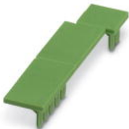
Klemmenabdeckung, 1 Streifen deckt bis zu 12 Klemmstellen ab, für ME BUS-Klemmenöffnung (Stiftseite)

Bitte beachten Sie, dass die hier angegebenen Daten dem Online-Katalog entnommen sind. Die vollständigen Informationen und Daten entnehmen Sie bitte der Anwenderdokumentation. Es gelten die Allgemeinen Nutzungsbedingungen für Internet-Downloads. ( http://download.phoenixcontact.de )