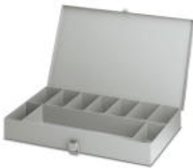
Sortimentkasten, aus Metall, unbestückt

Bitte beachten Sie, dass die hier angegebenen Daten dem Online-Katalog entnommen sind. Die vollständigen Informationen und Daten entnehmen Sie bitte der Anwenderdokumentation. Es gelten die Allgemeinen Nutzungsbedingungen für Internet-Downloads. ( http://download.phoenixcontact.de )