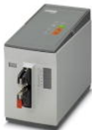
Universeller Elektrocrimper zur Aufnahme von Gesenken verschiedenster Kontaktelemente

Bitte beachten Sie, dass die hier angegebenen Daten dem Online-Katalog entnommen sind. Die vollständigen Informationen und Daten entnehmen Sie bitte der Anwenderdokumentation. Es gelten die Allgemeinen Nutzungsbedingungen für Internet-Downloads. ( http://download.phoenixcontact.de )