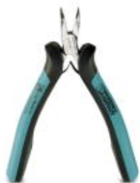
Elektronik-Spitzzange, gebogen 45°, Greiffläche glatt, mit Öffnungsfeder

Bitte beachten Sie, dass die hier angegebenen Daten dem Online-Katalog entnommen sind. Die vollständigen Informationen und Daten entnehmen Sie bitte der Anwenderdokumentation. Es gelten die Allgemeinen Nutzungsbedingungen für Internet-Downloads. ( http://download.phoenixcontact.de )