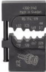
Gesenk, für Crimpfox-M, für Koaxial-Steckverbinder (BNC/TNC) RG 58/ 59/ 62/ 71, verpackt in einer anreihbaren Aufbewahrungsbox

Bitte beachten Sie, dass die hier angegebenen Daten dem Online-Katalog entnommen sind. Die vollständigen Informationen und Daten entnehmen Sie bitte der Anwenderdokumentation. Es gelten die Allgemeinen Nutzungsbedingungen für Internet-Downloads. ( http://download.phoenixcontact.de )