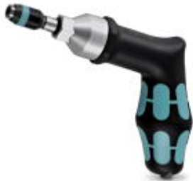
Drehmomentschrauber, Genauigkeit nach EN ISO 6789, einstellbar von 3 - 6 Nm

Bitte beachten Sie, dass die hier angegebenen Daten dem Online-Katalog entnommen sind. Die vollständigen Informationen und Daten entnehmen Sie bitte der Anwenderdokumentation. Es gelten die Allgemeinen Nutzungsbedingungen für Internet-Downloads. ( http://download.phoenixcontact.de )