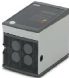
Ablängautomat, für Kabel, Litzen und Schrumpfschläuche, für 230 V-Netzspannung

Bitte beachten Sie, dass die hier angegebenen Daten dem Online-Katalog entnommen sind. Die vollständigen Informationen und Daten entnehmen Sie bitte der Anwenderdokumentation. Es gelten die Allgemeinen Nutzungsbedingungen für Internet-Downloads. ( http://download.phoenixcontact.de )