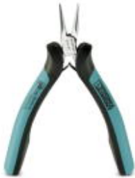
Elektronik-Spitzzange, Greiffläche glatt, mit Öffnungsfeder

Bitte beachten Sie, dass die hier angegebenen Daten dem Online-Katalog entnommen sind. Die vollständigen Informationen und Daten entnehmen Sie bitte der Anwenderdokumentation. Es gelten die Allgemeinen Nutzungsbedingungen für Internet-Downloads. ( http://download.phoenixcontact.de )