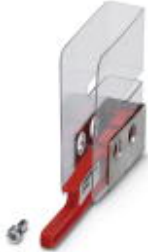
Schutzhaube für Crimpautomat CF 500, für Rohrkabelschuhe 0,34 - 2,5 mm 2 (RCT 2,5)

Bitte beachten Sie, dass die hier angegebenen Daten dem Online-Katalog entnommen sind. Die vollständigen Informationen und Daten entnehmen Sie bitte der Anwenderdokumentation. Es gelten die Allgemeinen Nutzungsbedingungen für Internet-Downloads. ( http://download.phoenixcontact.de )