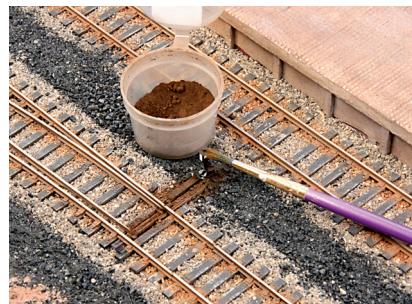
Nach dem Einbau auf der Anlage erfolgt die abschließende Patinierung mit schmutzig-braunen Pastellkreiden bzw. Trockenfarben