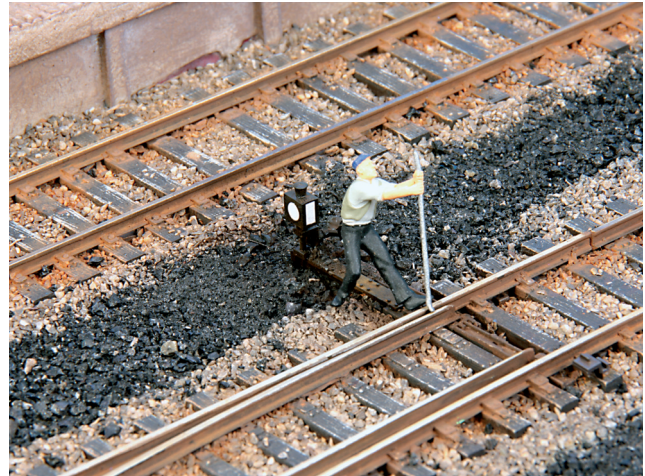
Offensichtlich wurde diese Weiche schon lange nicht mehr bedient und ist festgerostet. Hier hilft nur noch das Brecheisen

Verlängerung der entsprechenden Weichenschwelle, der Laterne, dem Stellhebel für das Gestänge zur Weiche und dem Handstellgewicht. Außerdem liegen Antriebsatruppen für ferngestellte Weichen bei, die alternativ zum Stellhebel verwendet werden können. Dann sollte allerdings auch das dazugehörige Seilzug-Pärchen nachgebildet werden, offen verlegt mit Seilzughaltern oder verdeckt in Nachbildungen der Blechkanäle. Doch das soll nicht Thema dieses Beitrags sein.