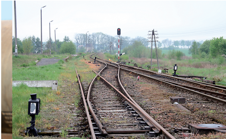
Ortsbediente Weichen oder, wie hier, fernbediente Weichenstellrichtungen, fotografiert in Greifenberg, kann man auch heute noch vielerorts antreffen

Weichen ortsgestellt - auch mit Kunststoff