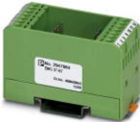
Bestückungs-Modul, bestehend aus Gehäuse, Anschlussklemmen MKDS 3 und Leiterplatte

Bitte beachten Sie, dass die hier angegebenen Daten dem Online-Katalog entnommen sind. Die vollständigen Informationen und Daten entnehmen Sie bitte der Anwenderdokumentation. Es gelten die Allgemeinen Nutzungsbedingungen für Internet-Downloads. ( http://download.phoenixcontact.de )