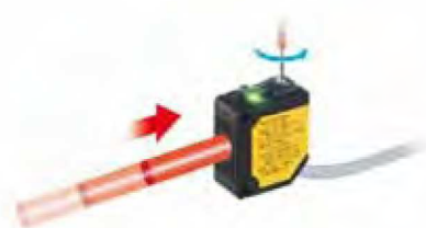
Potenziometer zur Lichtleistungsoptimierung