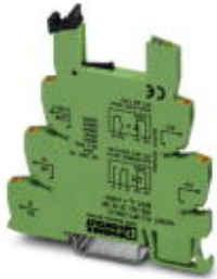
6,2 mm PLC-Grundklemmen mit Push-in-Anschluss, Eingangsspannung 24 V DC (ohne Relais- oder Optokopplerbestückung)

Bitte beachten Sie, dass die hier angegebenen Daten dem Online-Katalog entnommen sind. Die vollständigen Informationen und Daten entnehmen Sie bitte der Anwenderdokumentation. Es gelten die Allgemeinen Nutzungsbedingungen für Internet-Downloads. ( http://download.phoenixcontact.de )